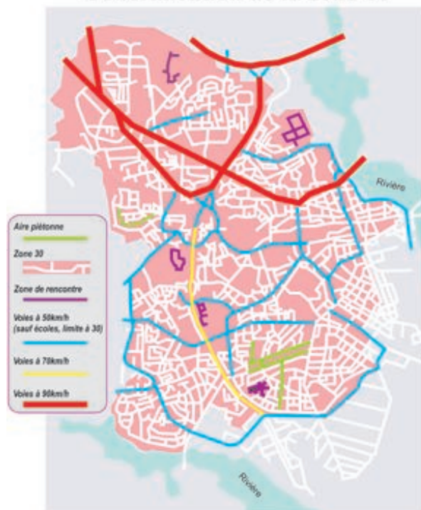
Plan théorique d'un réseau de voirie hiérarchisé