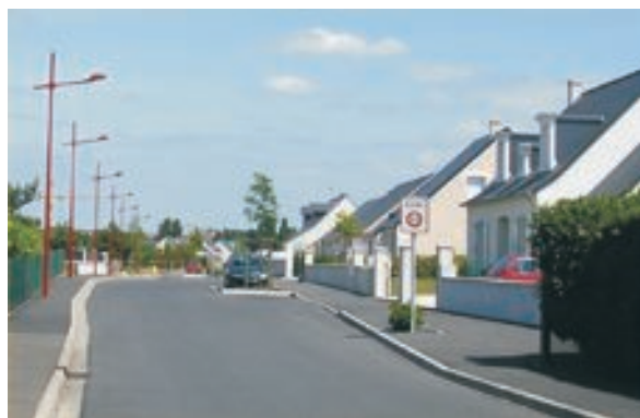
Rue résidentielle

La description de ces quatre situations n'est pas exhaustive.