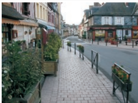
Section d'axe de transit