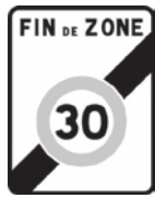
Panneau B51 Sortie d'une zone 30

La fin de la zone 30 peut être annoncée par un des panneaux suivants :