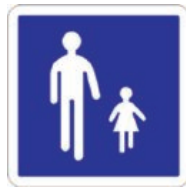
B54 Entrée d'une aire piétonne