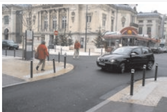
Rue commerce de proximité