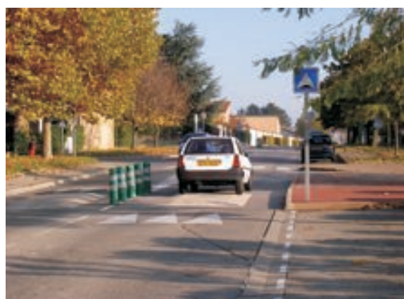
Rue de distribution du quartier