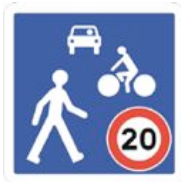
B52 Entrée d'une zone de rencontre